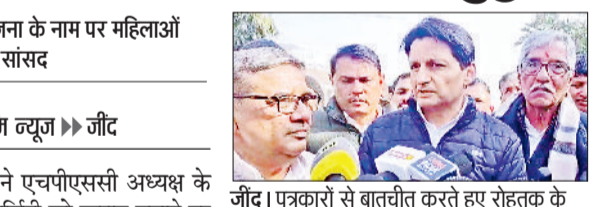
जीद। पत्रकारों से बातचीत करते हुए रोहताक के सांसद दीपेंद्र सिंह हुड्डा।

सांसद दीपेंद्र हुड्डा ने एचपीएससी अध्यक्ष के हरियाणा की युनिवर्सिटी को खराब बताने पर कहा कि यह जो उनका बयान है, इस बयान के आधार पर उन्हें बर्खास्त किया जाना चाहिए। अगर हरियाणा की युनिवर्सिटी इतनी खराब है कि बच्चों को काबिल नहीं बना सकती, तो शिक्षा मंत्री अपना इस्तीफा दे दें। क्योंकि 12 वर्ष से इनकी सरकार है। उसी हरियाणा की युनिवर्सिटी से निकल कर बच्चे यूपीएससी में टॉप हो रहे हैं। देश विदेश में आगे जा रहे हैं। मैंने भी हरियाणा युनिवर्सिटी से पढ़ाई की और फिर फिर एमबीए में टॉप किया। सांसद दीपेंद्र हुड्डा