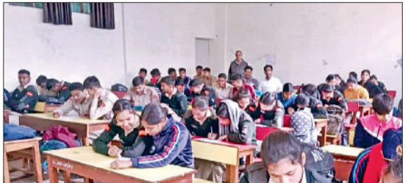
जीद। प्रतियोगिता में भाग लेते बच्चे।