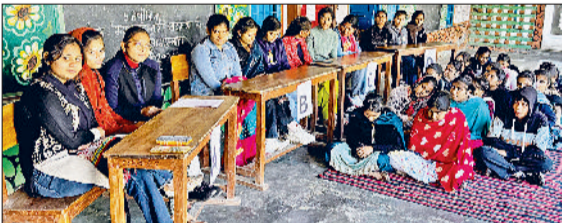
राजौद। कार्यक्रम में भाग लेते हुए विद्यार्थी।