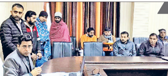
नरवाना। जनसमस्याएं सुनते हुए एसडीएम।