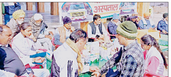
नरवाना। गांव करवाते हुए लोग।

कोई भी लापरवाही ना की जाए। प्राधिकरण सचिव ने बताया कि राष्ट्रीय विधिक सेवा प्राधिकरण सहायता हेल्पलाइन लाइन नंबर 15100 जारी किया गया है। इस की महिलाओं को देखभाल में कोई कमी नहीं रहनी चाहिए तथा महिलाओं के स्वास्थ्य से संबंधित