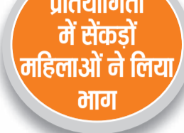
हरिभूमि न्यूज ॥ जुलाना

जुलाना उपमंडल के एसडीएम मुख्यातिथि के रूप में पहुंचे