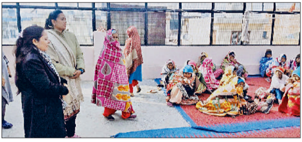
जीद। वृद्धाश्रम का निरीक्षण करती सीजेएम।