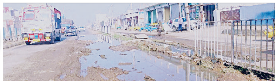
जीद। हाइवे पर जलभराव होने से भरा गंदा पानी व टूटी सड़क।