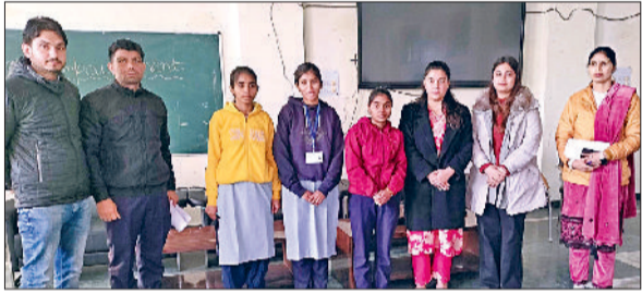
जीद। प्रतियोगिता में विजेता रहे बच्चे।

तय किए गए। बैठक में यह तय हुआ कि दोपहर की सभी बुकिंग अब केवल शाम 5 बजे तक ही मान्य होंगी। यदि किसी कार्यक्रम की अवधि शाम 5 बजे के बाद तक बढ़ती है, तो उसके लिए प्रति घंटे के हिसाब से अतिरिक्त चार्ज लिया जाएगा। एसोसिएशन ने साफ किया कि यह नियम सभी पैलेसों पर समान रूप से लागू होगा और इसमें किसी प्रकार की छूट नहीं दी जाएगी। कोई पैलेस संचालक इन नियमों का उल्लंघन करता है तो उसके खिलाफ एसोसिएशन द्वारा कड़ी कार्रवाई की जाएगी।