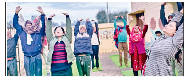
जीद। सूर्य नमस्कार का अभ्यास करते हुए साधक।

सामग्री की गुणवत्ता, कार्य की मजबूती तथा तकनीकी मानकों का विशेष रूप से ध्यान रखा जाए। उन्होंने कहा कि सरकार द्वारा स्वीकृत योजनाओं का उद्देश्य आमजन को बेहतर मूलभूत सुविधाएं उपलब्ध कराना है। इसलिए इन कार्यों की नियमित मॉनिटरिंग अत्यंत आवश्यक है। उन्होंने बताया कि भविष्य में भी एमपीएलएडी योजना सहित जिला परिषद एवं अन्य योजनाओं के तहत चल रहे सभी विकास कार्यों का नियमित निरीक्षण किया जाता रहेगा ताकि कार्य समय पर और गुणवत्ता के साथ पूर्ण हो सकें।