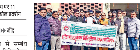
जीद। डायरेक्टर के नाम ज्ञापन भेजते हुए एसोसिएशन के पदाधिकारी।