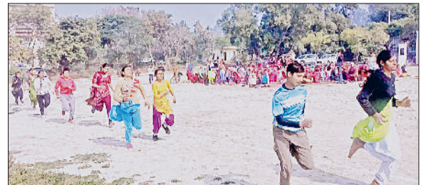
जुलाना। रेस प्रतियोगिता में भाग लेती महिलाएं।