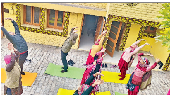
कैथल। चौशाला में योगासन करते साधक।