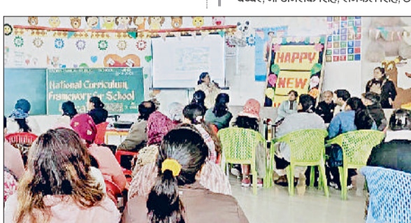
जीद। कार्यशाला में भाग लेते हुए अध्यापक।